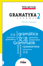
TESTUJ SWÓJ POLSKI GRAMATYKA 2 Grammar 2 Renata Szpigiel